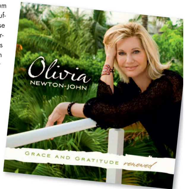
„Grace and Gratitude“ ist im September 2010 bei dem Label Emm/Chordant erschienen.